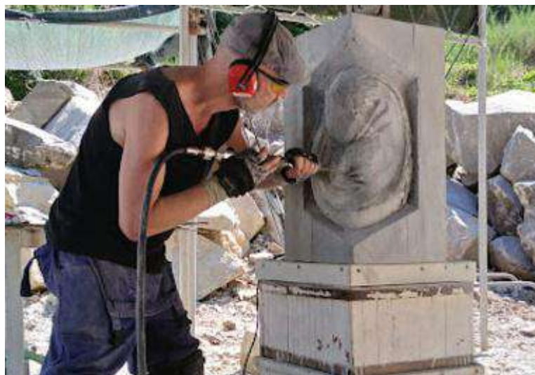
Uno degli scultori a lavoro nella cava di Vellano