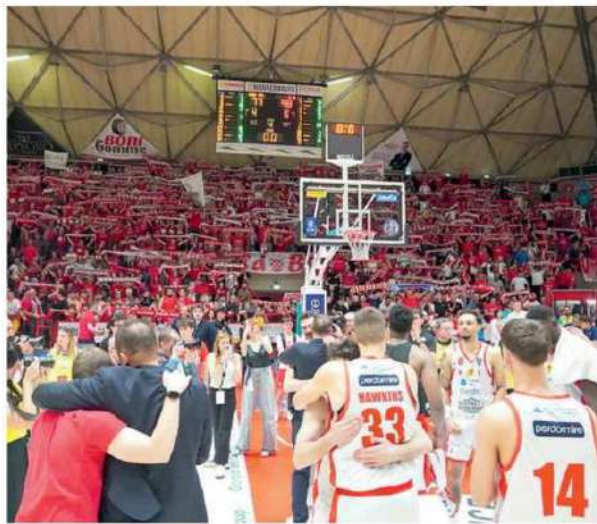
Il saluto della squadra alla Baraonda alla fine della scorsa stagione

Il precampionato di Estra è molto ricco e idealmente diviso in due parti: nella prima sa-