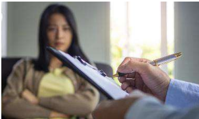
L'ex professionista di Montecatini sarebbe responsabile di palpeggiamenti, toccamenti e contatti diretti reiterati con le pazienti che aveva in cura

È accusato di abusi sessuali pluriaggravati nei confronti di 23 ragazze, tra i 14 e i 20 anni, dieci delle quali minorenni all'epoca dei fatti. Si terrà il 25 settembre, nelle aule del tribunale di Pistoia, davanti al Gup, l'udienza relativa alla richiesta di rinvio a giudizio presentata dal pubblico ministero Giuseppe Grieco nei confronti di un uomo di 46 anni, ex appartenente all'ordine degli psicologi, all'epoca dei fatti titolare di uno studio in città. L'ex professionista (di cui non riportiamo il nome a tutela delle presunte vittime) è difeso dagli avvocati Mauro Cini e Giovanni Flora del foro di Prato. L'uomo è stato arrestato lo scorso novembre dagli agenti del commissariato di Montecatini che hanno seguito l'attività investigativa. L'accusa di abusi sessuale è aggravata perché sarebbe stata esercitata nei confronti di alcune ragazze minori di 18 anni e ai danni di persone a lui affidate per ragioni di cura. L'uomo sarebbe responsabile di palpeggiamenti, toccamenti e contatti diretti reiterati con le pazienti che aveva in cura