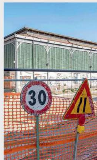
► Poggiali in Firenzell