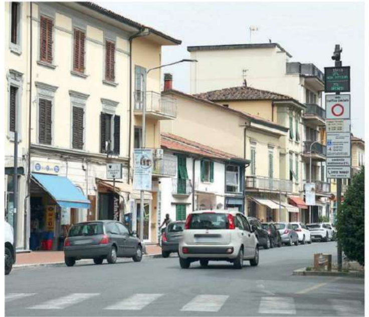
Una veduta di corso Roma

le attività promozionali, con l'auspicio di creare un calendario ricco e variegato che possa soddisfare le esigenze di un pubblico ampio e diversificato. Con il sostegno dei commercianti e la collaborazione dell'amministrazione, corso Roma si prepara a vivere una nuova stagione di crescita e innovazione», viene spiegato.