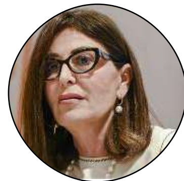
Daniela Santanchè Ministro del Turismo

A Roma si rinvia a settembre il confronto sulla rimodulazione della tassa di soggiorno, su cui in molti invocano un intervento anche per regolare il fenomeno dell'overtourism: previsto un tavolo tra Governo e Comuni. «In tempi di sovraturismo - ha detto il ministro Santanchè - ci stiamo confrontando perché sia un reale aiuto a migliorare i servizi e a rendere più responsabili chi la paga».