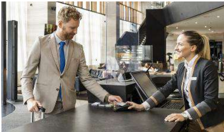
La tassa di soggiorno negli hotel in città verrà rimodulata nel nuovo anno

Come cambiano le tariffe comunali dell'imposta di soggiorno? In attesa dei numeri ufficiali, grosso modo, è possibile dire che una persona che soggiorna fino a una settimana in un tre stelle, passerà da uno a due euro a notte, in quattro stelle da un euro e quaranta a due e ottanta a notte, e da uno e settanta a tre e quaranta in un cinque stelle. Slittano a settembre il confronto con le categorie economiche e gli enti locali e le eventuali decisioni sulle possibili