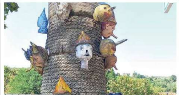
L'Albero di Pinocchio nella piazzetta di Collodi

Le opere di Eugenio Taccini sono diffuse in tutto il