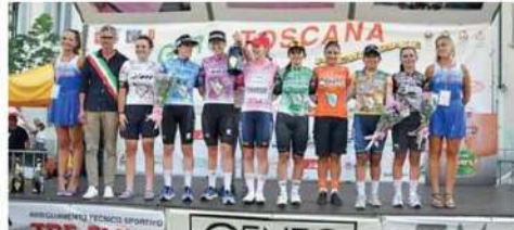
Le premiate nel 2023 al Giro della Toscana femminile

Sono quattro giorni di sport e di festa grazie anche alle numerose iniziative collaterali che quest'anno avranno come piatto forte la presenza di un ospite d'eccezione come Francesco Moser e di una madrina, altrettanto importante, come l'ex ciclista Mara Mosole.