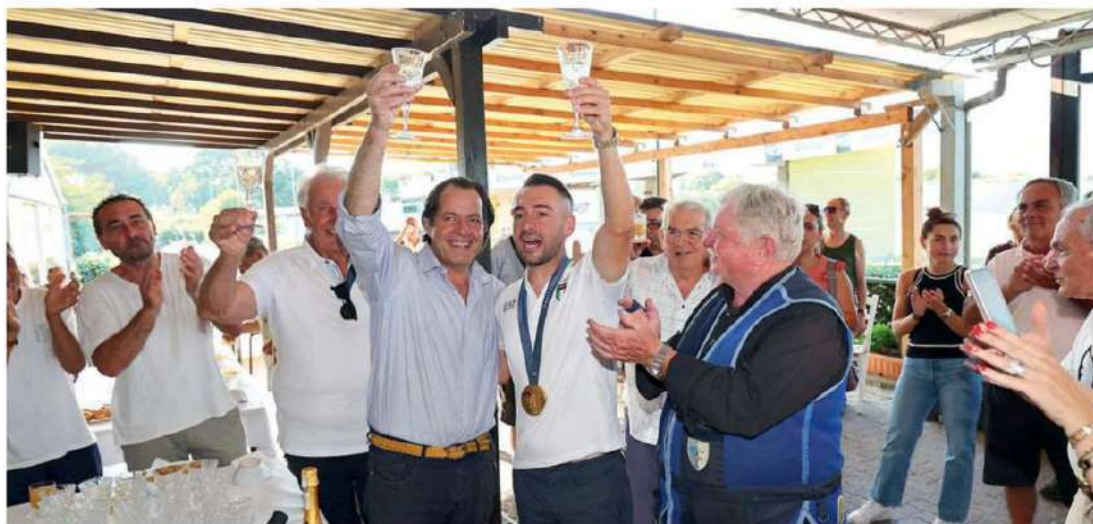
in Pescia XIX