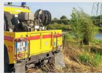
in Prato IX