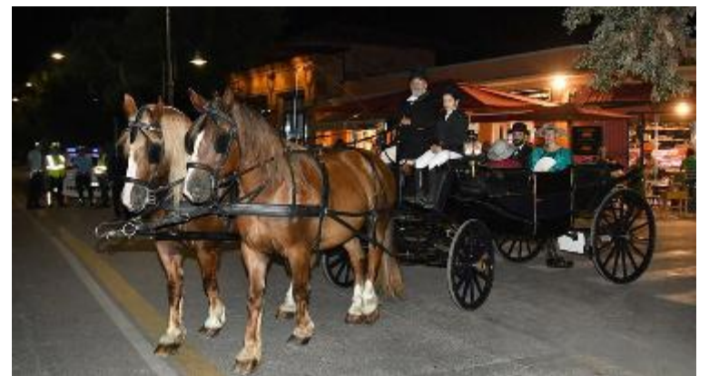
Una delle carrozze in concorso a Incanto Liberty (Rosellini)

hanno partecipato al concorso di tradizione e eleganza. I cittadini, ma anche i numerosi turisti presenti in città, si sono fermati per le vie del centro ad ammirare qualcosa di surreale che riporta immediatamente indietro nel tempo, in un tempo che non c'è più ma che continua a raccogliere applausi. Le carrozze in legno rigorosamente tutte ricollocabili tra le fine dell'800 e l'inizio del '900, gli equipaggi perfettamente curati negli abiti e negli accessori ed infine i cavalli che per