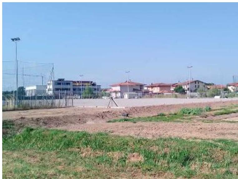
Sul campo de La Palagina è in corso un intervento in partenariato pubblico-privato tra Comune di Pieve a Nievole e la società di calcio Giovani Via Nova