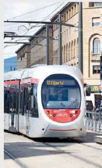
in Firenze III