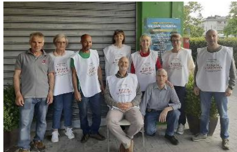
Un gruppo di volontari della Comunità Solidale di Lamporecchio

La CSL è nata ufficialmente nel 2013 come aggregatore di associazioni ed enti che si sono uniti per fare rete. Qui il mondo del