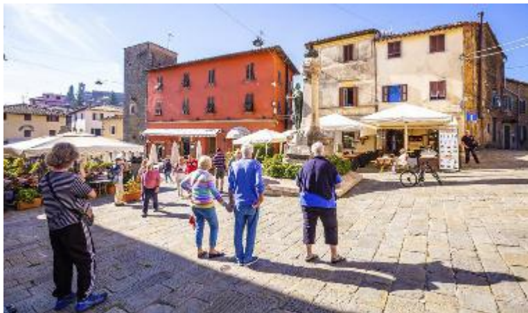
Hotel e ristoranti stanno accogliendo i turisti anche a Montecatini Alto

La gran parte delle presenze è costituita da gruppi stranieri venuti in Toscana per fare il tradizionale giro delle città d'arte. Questo è il lavoro principale di Montecatini da quando l'identità legata alle acque è iniziata ad andare in affanno. La vicenda delle Terme, dopo la gara per la vendita di tutti i beni strategici con offerte non inferiori a 42 milioni di euro, procede in