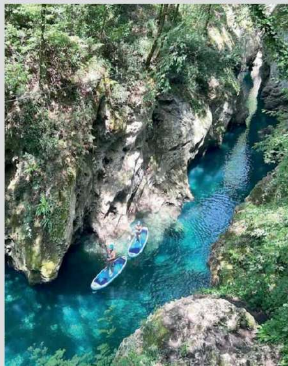
Le Strette di Cocciglia, sul torrente Lima, sull'Appennino toscano-emiliano

La più famosa, quest'estate, è stata Chiara Ferragni. Che, a luglio, nel bel mezzo della solita vacanza glamour in Versilia, tra cene stellate e shooting in spiaggia, ha scelto di farsi un bagno alternativo, in un posto altrettanto alternativo, in mezzo al bosco. Una sorpresa? Non per chi la Toscana la conosce bene e sa che è ricca di questi paradisi rigeneranti, incastonati tra colline e montagne.