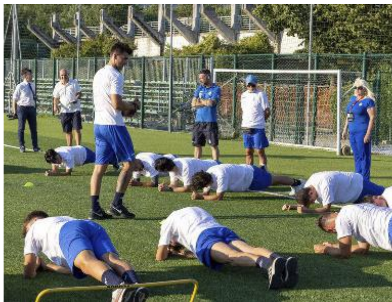
Il Valdinievole Montecatini esordirà in Coppa Italia il 1 settembre (Goiorani)

Le società di Prima e Seconda Categoria esordiranno invece nei rispettivi campionati solo il 15 settembre. Ma anche per loro il 1 settembre lascerà in dote il ritorno in campo, in Coppa Toscana. C'è ad esempio l'Atletico Casini Spedalino neopromosso che se la vedrà con il Quarrata (e chi perderà giocherà contro il Tempio Chiazano di coach Nencini, il prossimo 8 settembre). C'è CQS Pistoia-Capanori, con la perdente che andrà a sfidare subito l'AM Aglianese. L'ultima giornata dei triangolari è stata fissata per il 25 settem-