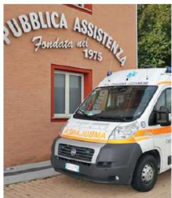
La sede della Pubblica Assistenza di Chiesina Uzzanese in via Turati, non lontano dalla Camporcioni, davanti al centro civico Il Fiore

sapere che «i nuovi consiglieri sono subito resi operativi, iniziando immediatamente a programmare per il futuro». In programma ci sono diverse attività. Il 2 settembre inizia per esempio un corso di livello base di soccorso, gratuito e aperto a tutta la cittadinanza; nel mese di ottobre verrà programmato un corso per autisti di emergenza e urgenza; mentre ad inizio 2025 proseguirà il corso di soccorso di